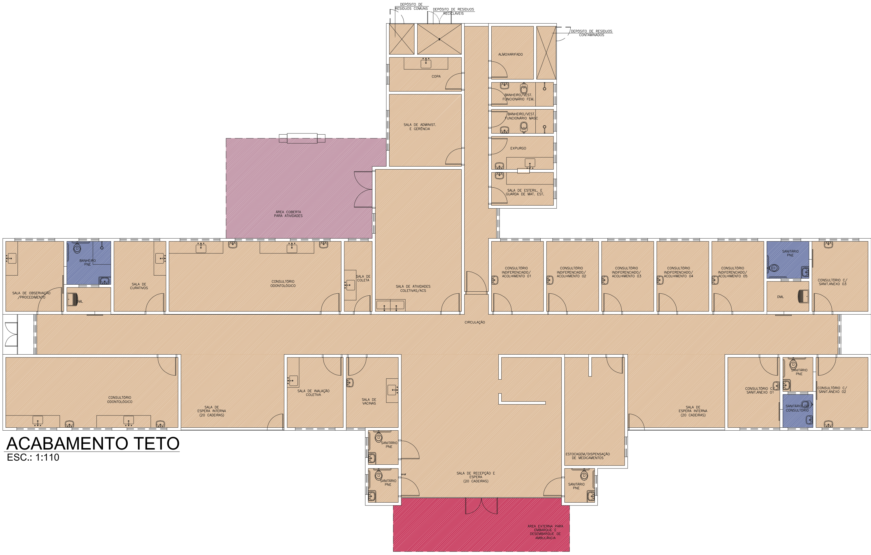
ACABAMENTO TETO ESC.: 1:110